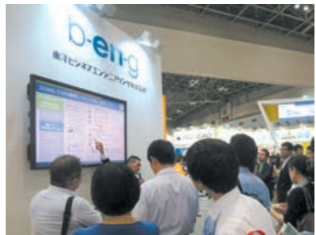
足を止めてミニセミナーを聴くお客様

おかげさまで、当社ブースには3日間で7,000名を超えるお客様にお立ち寄りいただき、多くの来場者に当社の製品とサービスを知っていただくことができたのではないかと思います。