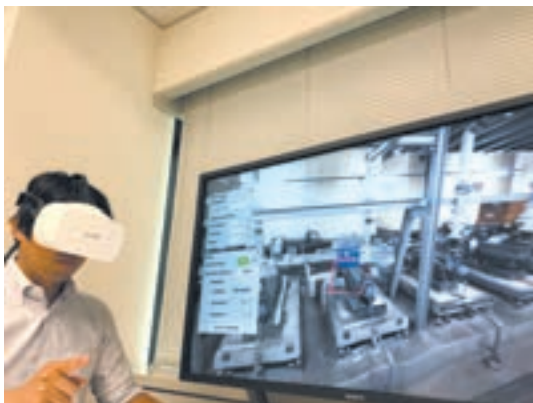
仮想現実を利用した学習ソリューション

今回の出展では「ものづくりデジタルイゼーション」をテーマとしたデモ展示とミニセミナーを行いました。展示コーナーは、パートナー各社様が各1箇所と当社の6箇所合わせて11箇所。当社からは生産・原価管理パッケージの新製品「mcframe 7」、「mcframe IoT」ソリューション群、設計と生産を双方向に連携する「mcframe PLM」をご紹介しました。また、7月に新製品リリースの発表を行った仮想現実（VR）技術を利用して熟練技術者のノウハウを学習するためのソリューションも出展させていただきました。