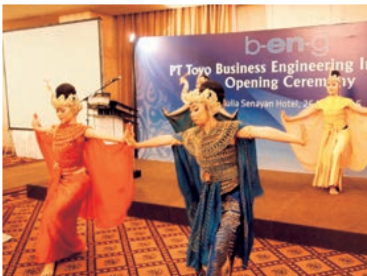
セレモニーで披露されたインドネシア伝統舞踊