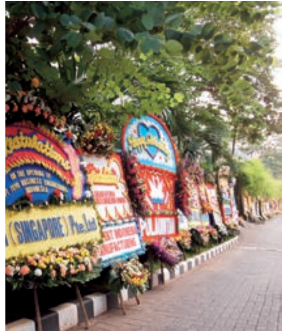
取引先様から贈られたお祝いの花輪 (ホテル前の歩道)

当社は、グローバル市場での競争力強化を図る企業様に対してITによるグローバル展開支援を推進しております。継続的な海外サポート体制強化により、東南アジア地域における営業力の強化とサービス品質の向上を図っております。